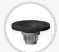
KIT VANN AV