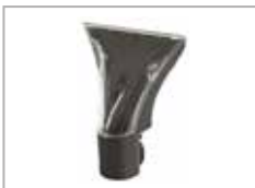
Stor gjennomsiktig dyse