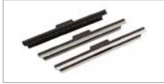
Gulv chassis 300-400 mm Støv - væske - setetrekk