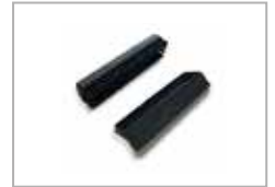
Vindusvasker innsats 150 mm Børste - gummi