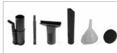
Tilbehørssett; damp-munnstykke, adapter til damp-munnstykke, dyse 80, flatt munnstykke, påfyllingstrakt, avløpsdyse.