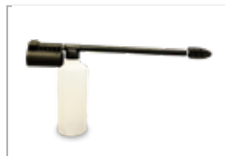
Sprayflaske for desinfisjonsmiddel