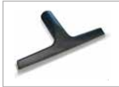
Vindusvasker 250 mm