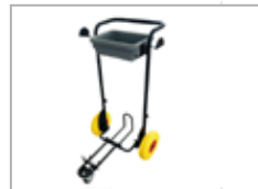
Transporttralle med store hjul