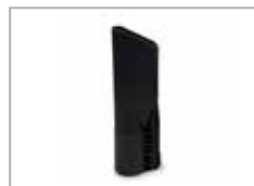
Støvsuger damp munnstykke med dyse