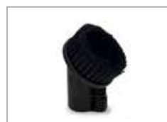
Støvsuger damp børste myk bust