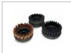
ø60 mm børster bronse - nylon - stål