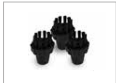
ø30 mm børster nylon - stål - messing