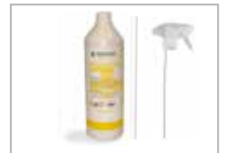
Multigrass - sprayhode