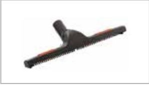
Gulvmunnstykke 300-400 mm