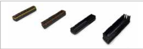
Glassvasker innsats 150 mm messing - hestehår - hard nylonbørste - nylonbørste 250 mm