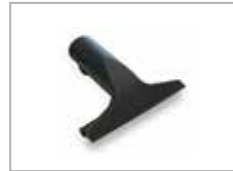
Vindusvasker 150 mm