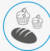
BAKERIER OG KONDITORIER